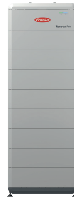
Fronius Reserva Pro

Die Fronius Reserva ist die effiziente Speicherlösung für Einfamilienhäuser und harmoniert ideal mit dem Fronius GEN24 Plus. Dank der DC Kopplung wird Solarstrom nahezu verlustfrei gespeichert und der Eigenverbrauch deutlich erhöht. Die kompakte Bauform macht sie besonders geeignet für enge Räume, während die robuste LFP Technologie für hohe Sicherheit und lange Lebensdauer steht.